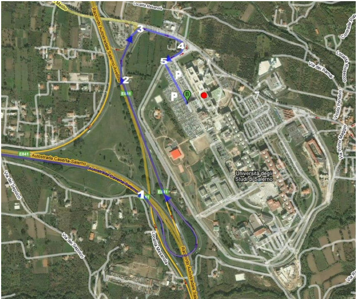
Figura 1: Mappa del Campus di Fisciano (Punti di interesse)