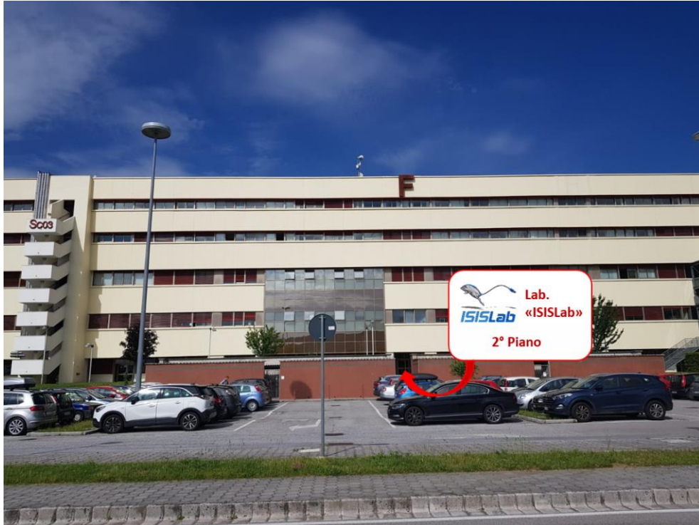
Figura 4: Ingresso per ISISLab (Punto rosso della mappa)