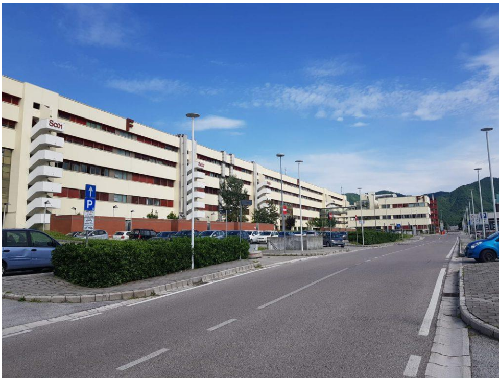
Figura 3: Parcheggi a destra e sinistra (Punto 5 della mappa)