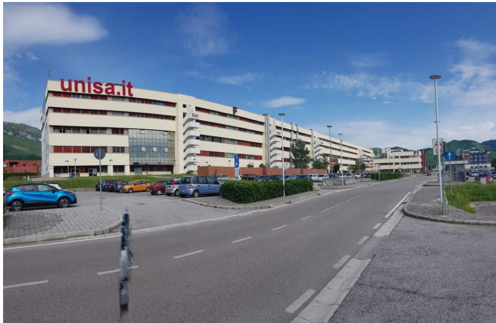
Figura 2: Svoltare a sinistra: Il Campus (Punto 4 della mappa)